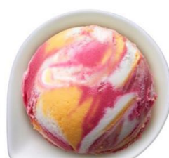
【ビビットマーブル】