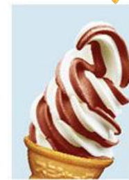
【バニラ&チョコレート】