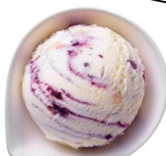
【ブルーベリーレアチーズケーキ】