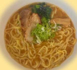
豚骨醤油らーめん