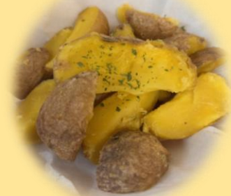
インカのめざめポテト