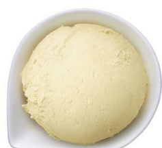
【あじわいバナナミルク】