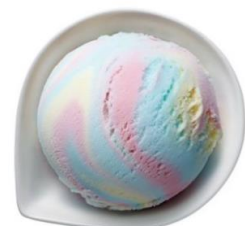
【パステルマーブル】