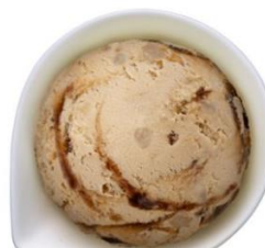
【つぶもち黒蜜きなこ】